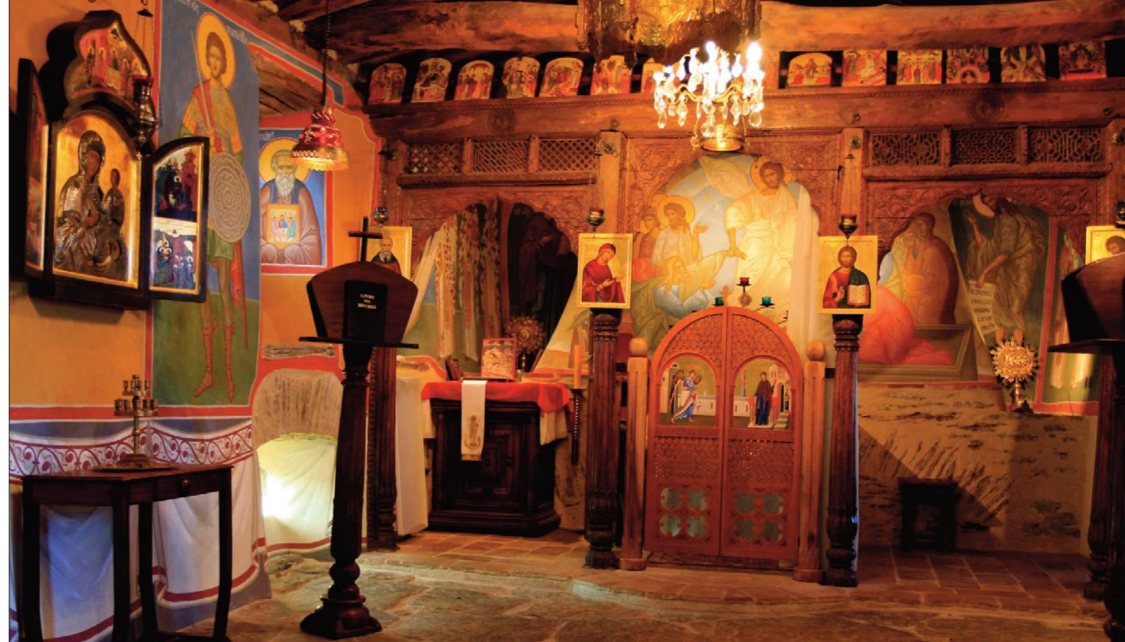
La chapelle du skite Sainte Foy

Il nous aide à respirer, à inspirer, à expirer, à nous sentir lourd de la Présence dans la rétention !