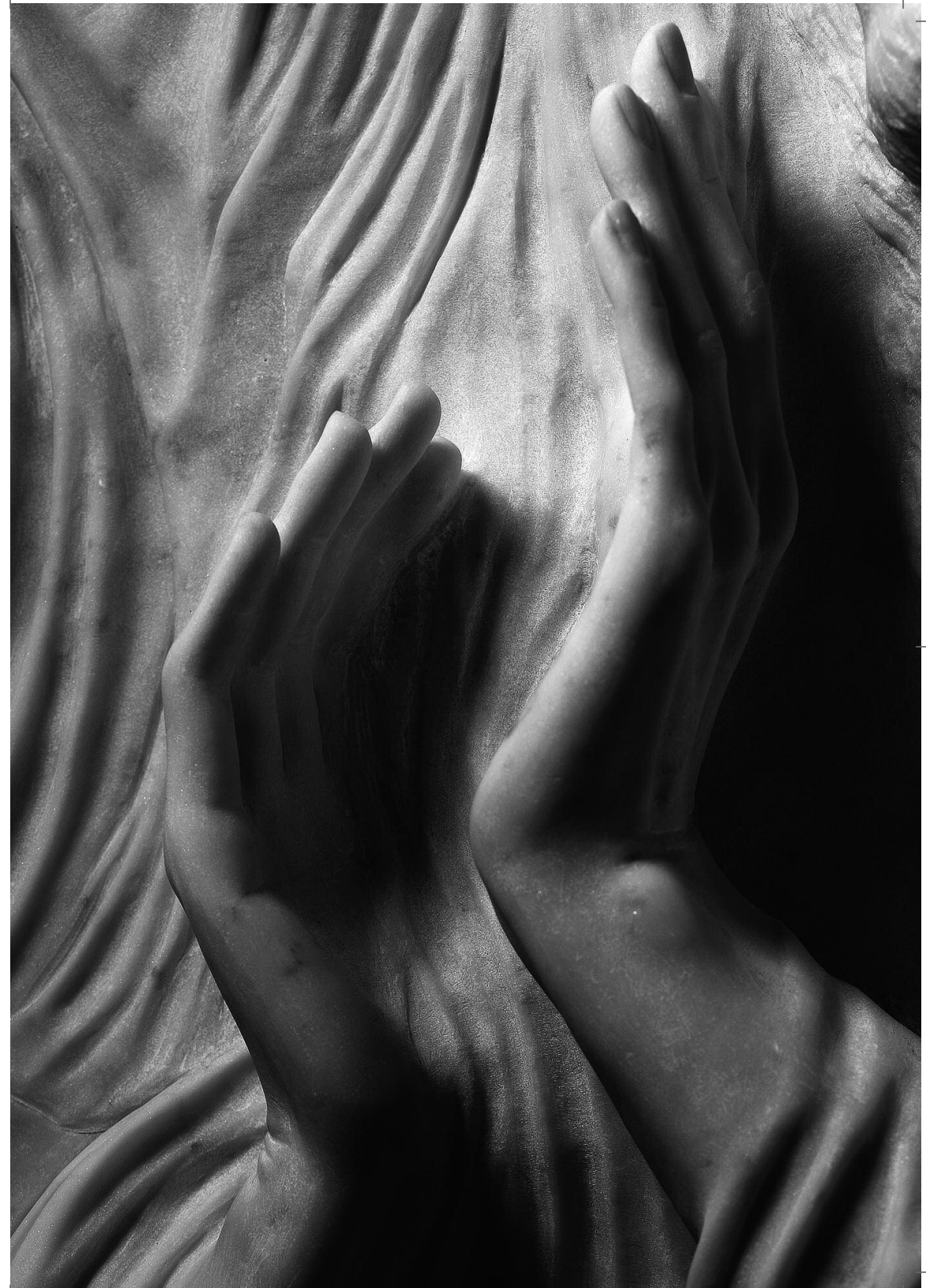
Détail, Jésus rencontre Marie, sa très sainte Mère.