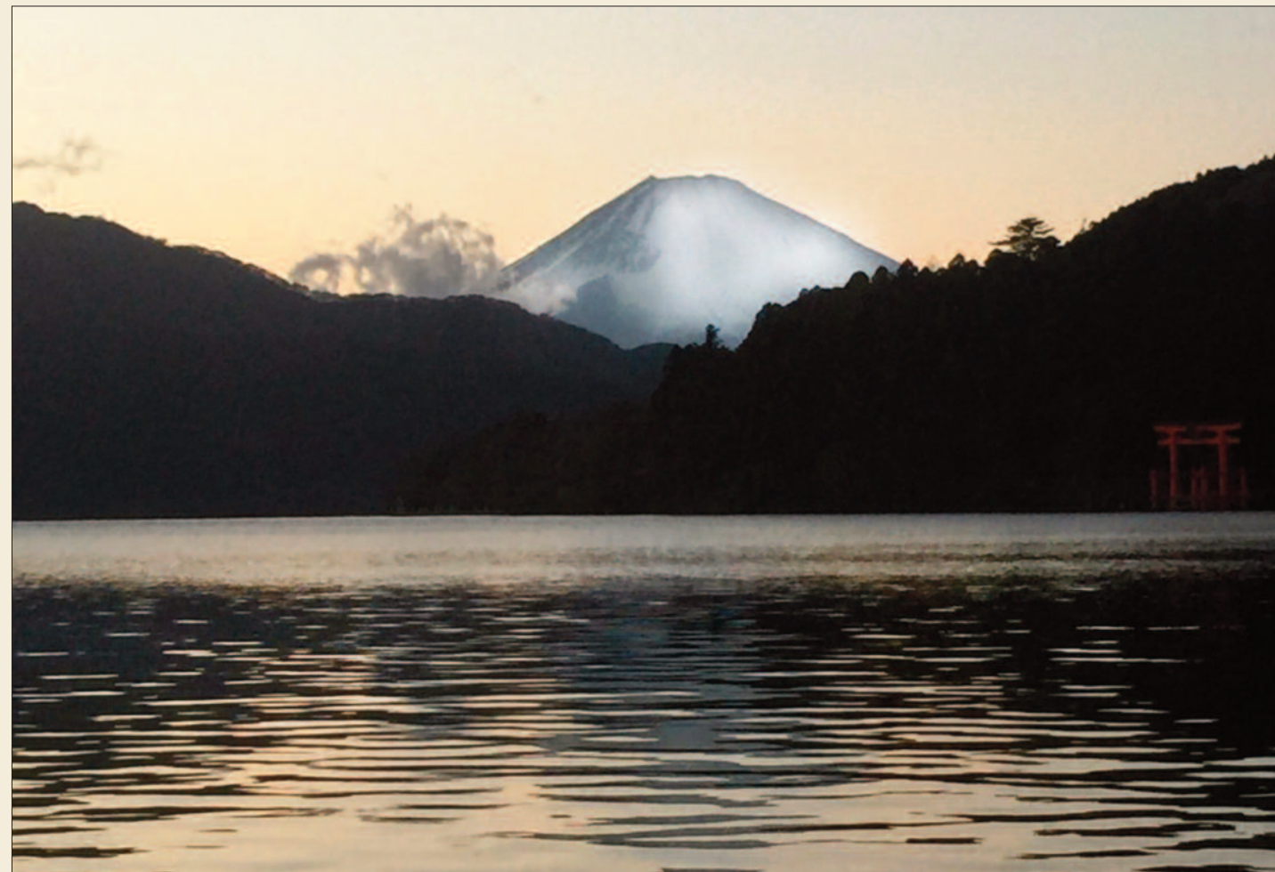
Face à chaque étincelle de lumière, devant chaque parcelle de la nature, la photo amène à l'émerveillement.

Il animera une session en juillet 2021 (du 12 au 16) sur Le Cantique des cantiques - information sur www.acielouvert.org .